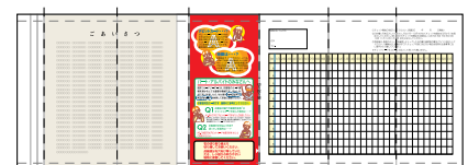
▲セキュリティチェックシート

セキュリティチェックシートが改訂され、2004年1月から加盟店様への配布が始まりました。デビットカードのセキュリティを高めるため、セキュリティチェックシートの有効活用をお願いします。