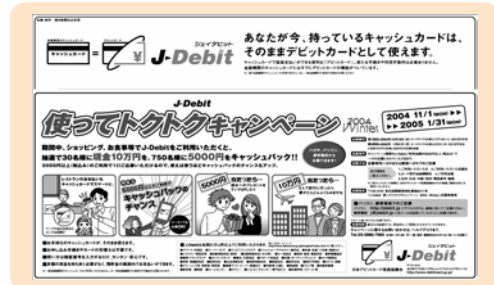
<朝日新聞全国版のキャンペーン広告> 2004年12月10日(金)の朝刊に掲載

J-Debit使ってトクトクキャンペーン2004 Winterを2004年11月1日(月)～2005年1月31日(月)まで、実施しています。年末年始の利用の高い時期に合わせた恒例のキャンペーンです。前回に引き続き、ポスターや応募はがきを全金融機関・加盟店に配布したほか、12月の1ヶ月間全国でJR等での交通広告を展開しました。