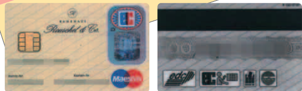
▲「edc/マエストロ」カード。ゲルトカルテ機能付き

もうひとつ、ドイツで1996年から普及しはじめたカードが「ゲルトカルテ (GeldKarte)」です(写真)。プラスチックカードにICチップを搭載し、プリペイド(前払い)式の電子マネー機能を提供するサービスで、電車・バスの乗車券販売機、公衆電話、自動販売機、駐車場など、小銭での支払いを必要とするさまざまなシーンで利用できるようになっています。