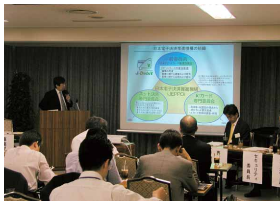
情報処理センター連絡会の様子

出席者アンケートの結果によると、ほとんどの方から「会議の内容については理解できた」との回答が寄せられ、「次回開催について」の設問に対しては、「開催してほしい」という意見が90%以上を占めました。寄せられた意見でも「有益な情報が入手できて大変内容の濃い連絡会でした」「会議出席により、少々解りにくい点の内容整理ができました」など、好評で会議自体を成功裡に終了することができました。