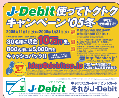
〈電車内広告のステッカー〉

ポスター等を店頭へ掲出し、多くのお客様にご応募いただけるようご協力をよろしくお願いいたします。